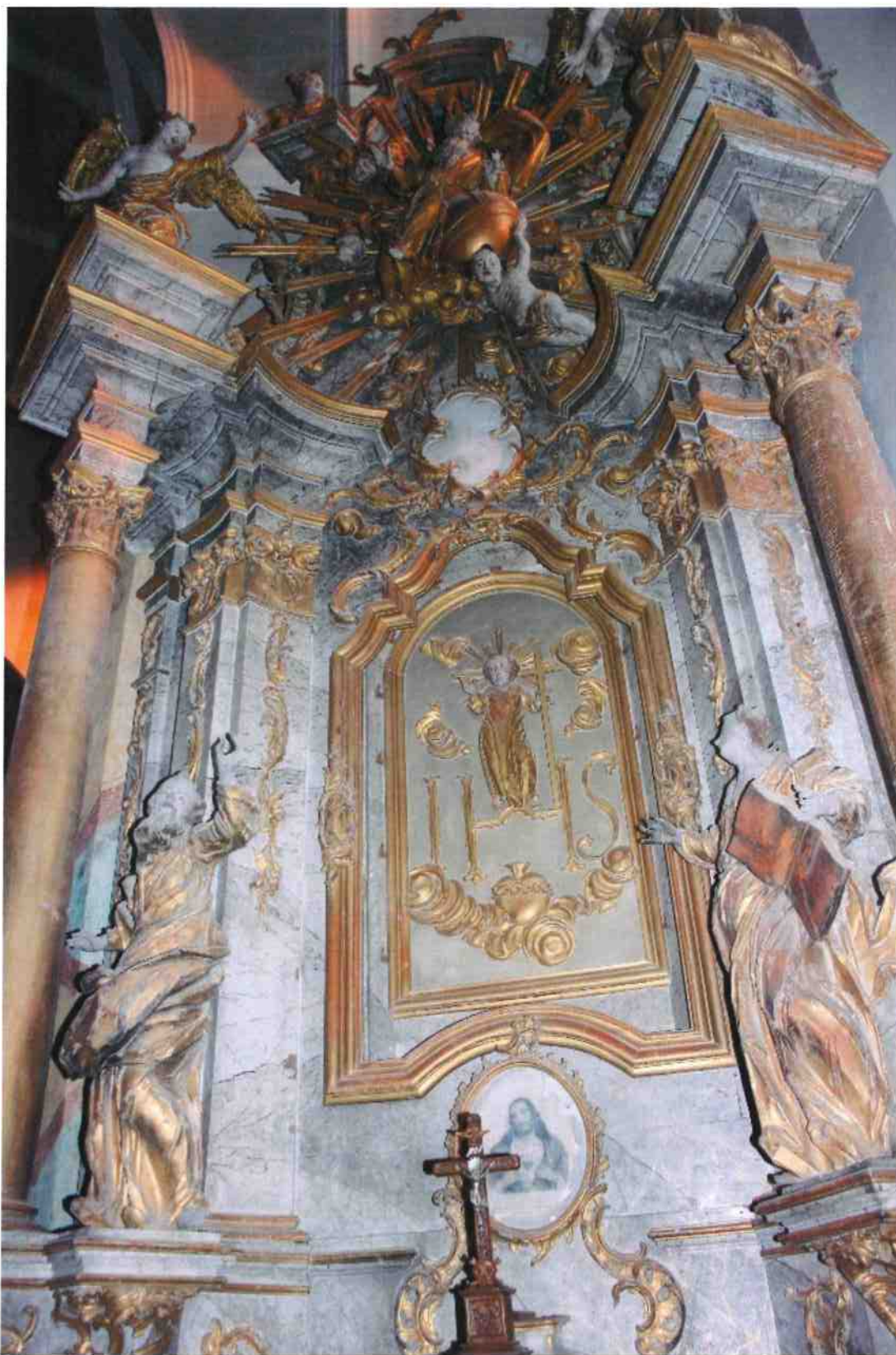
FOT 2. OŁTARZ BOCZNY W PD. RAMIENIU TRANSEPTU, PÓŻNOBAROKOWY (ROKOKO) Z LAT 1780-1781 z kościoła poddominikańskiego p.w. NMP i św. Jacka w Klimontowie. Widok na retabulum i centralną część ołtarza. Data wykonania fotografii: 04.01.2023