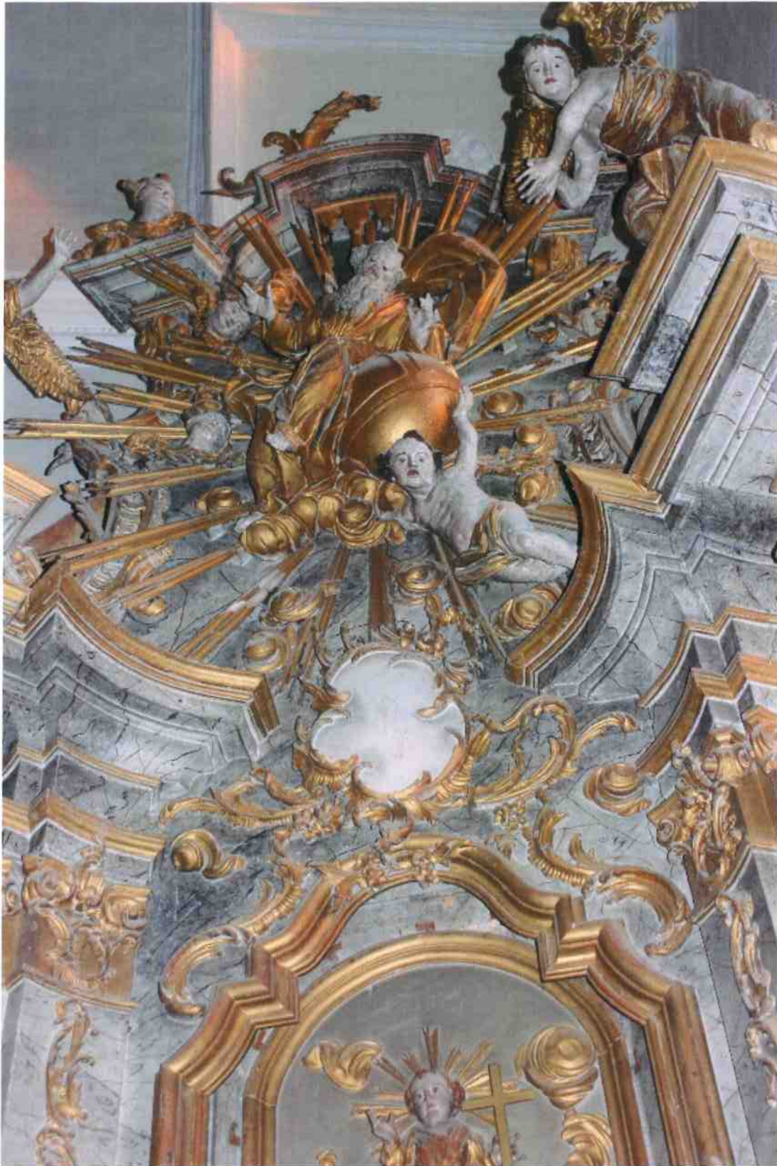
FOT 3. OLTARZ BOCZNY W PD. RAMIENIU TRANSEPTU, PÓŻNOBAROKOWY (ROKOKO) Z LAT 1780-1781 z kościoła poddominikańskiego p.w. NMP i św. Jacka w Klimontowie. Widok na szczyt ołtarza z figurą Boga Ojca. Data wykonania fotografii: 04.01.2023