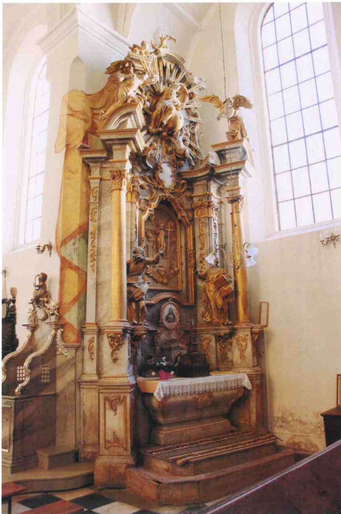
FOT 1. OLTARZ BOCZNY W PD. RAMIENIU TRANSEPTU, PÓŻNOBAROKOWY (ROKOKO) Z LAT 1780-1781 z kościoła poddominikańskiego p.w. NMP i św. Jacka w Klimontowie Widok na ołtarz. Data wykonania fotografii: 04.01.2023